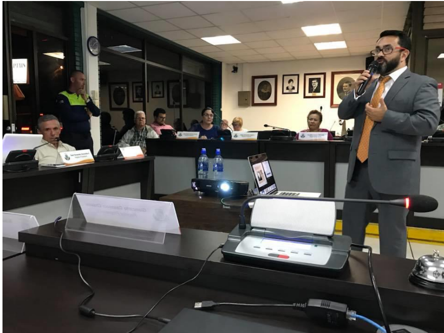
Audiencia: Sr. Edwin Estrada, Viceministro de Telecomunicaciones.

El Concejo Municipal 2016-2020, dejó avanzados en su tramitación tres propuestas reglamentarias que fueron sometidas a consulta pública no vinculante en el Diario Oficial La Gaceta y se encuentran pendientes de su revisión final para la aprobación definitiva: