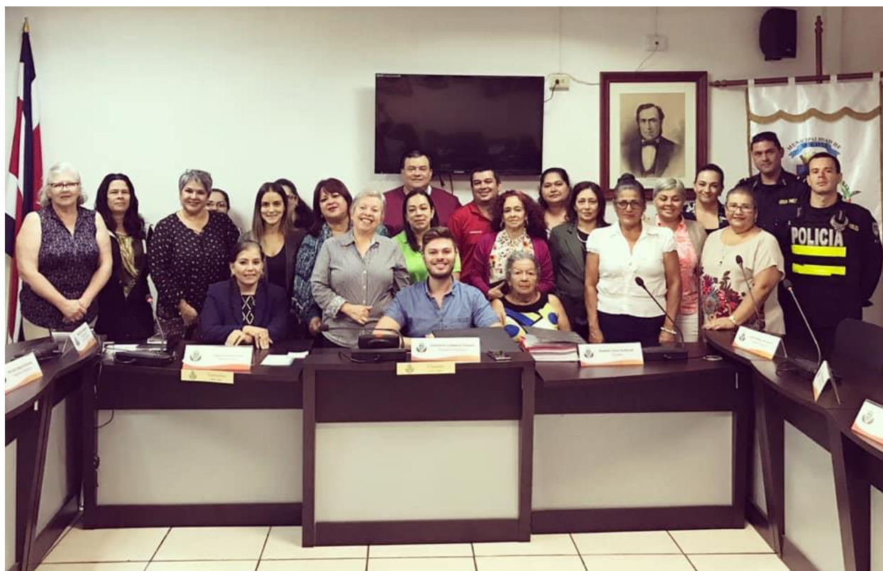
Actividad de Presupuestos Participativos (Extraordinario N°01-2019)

Como se desprende de los cuadros anteriores, mi gestión fue propositiva, constructiva y sobre todo, apoyando siempre todo aquello que se consideró importante para el desarrollo del cantón.