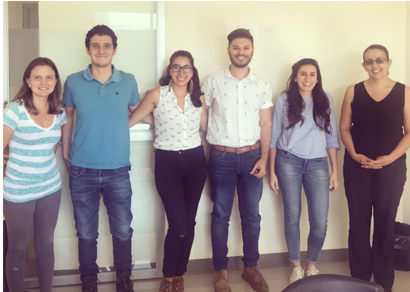
Comisión de Asuntos Ambientales Ampliada, 2019

No se omite manifestar que la integración de las comisiones fue, esencialmente, la que las mismas fracciones políticas propusieron, con el fin de que los ediles se sintieran a gusto trabajando en las áreas que resultaban de su interés y con el fin de tomar esa decisión en colectivo y no como unilateral o arbitraria como ocurrió en los primeros dos años de gestión.