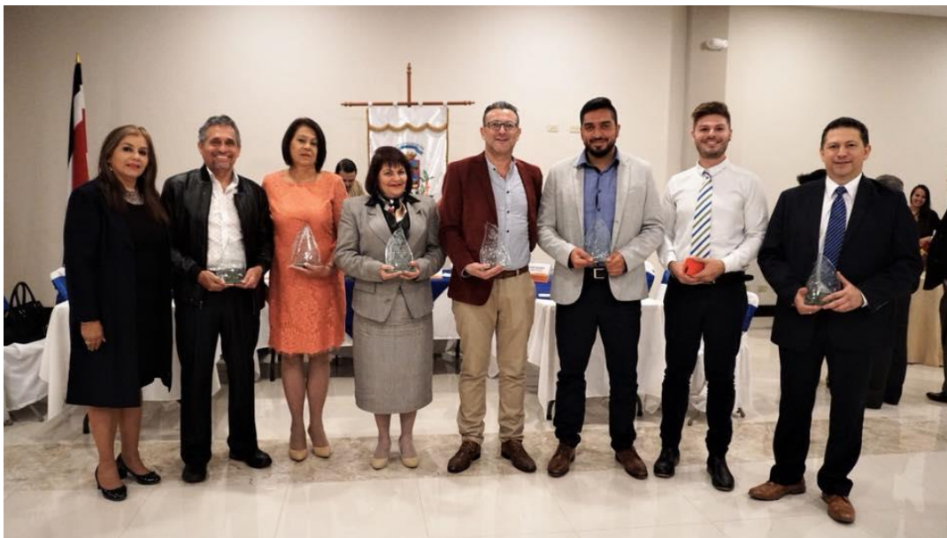
Ex Presidentes Municipales de Moravia en la celebración del 104 años del cantonato.

Adicionalmente, el Reglamento del Concejo Municipal de Moravia, atribuye al Presidente una serie de funciones con el fin de hacer operativo el orden en las sesiones municipales.